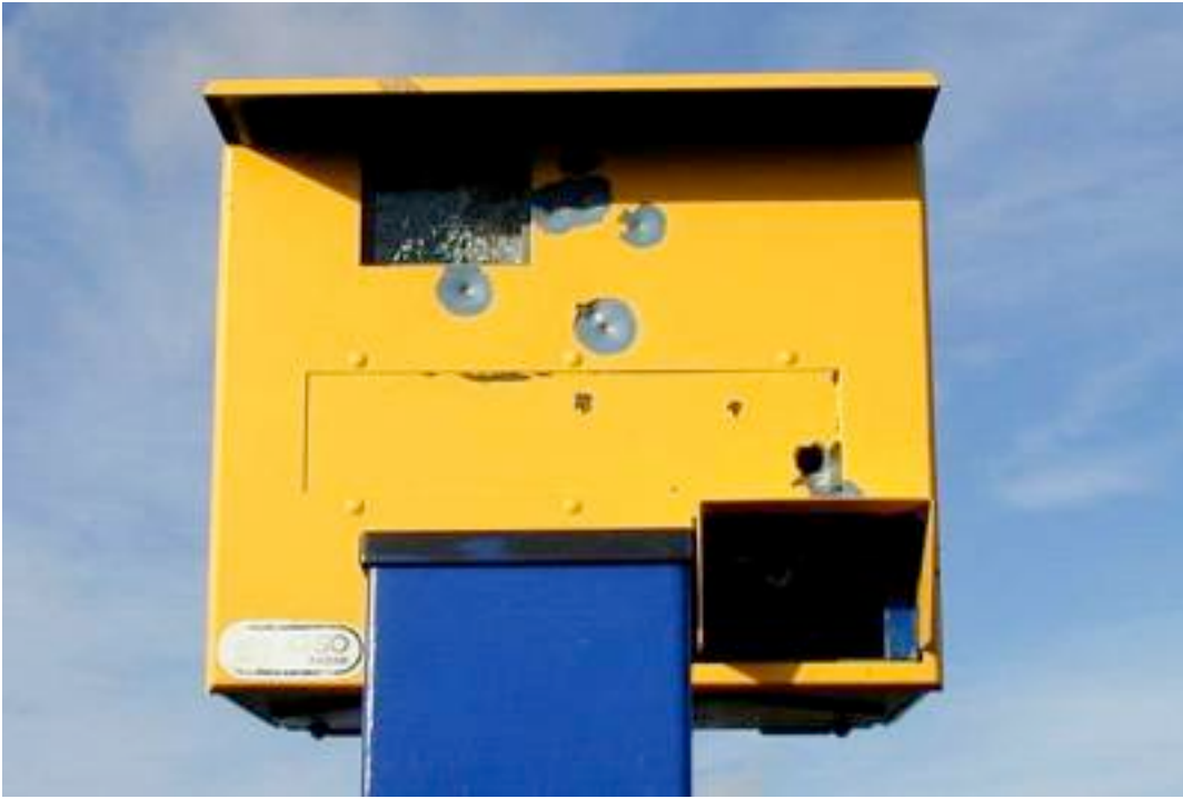
BOMBARDEMENT SUR BOX.....