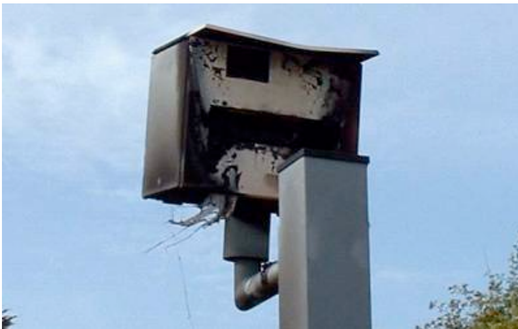
GRILLAGE DE BOX AU LANCE FLAMME.....

z'ont même pas eu le temps de le connecter 🙌 🙌 🙌