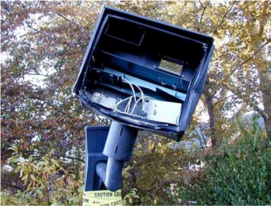
TORNADE SUR BOX.....